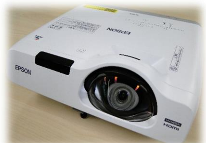
EPSON EB-535W 3400lm

二つ目は、超短焦点モデルのプロジェクターです。このプロジェクターは、約83cmの距離から80インチの映像を映し出すことができます。それに加えて3400lmの明るさがあるので、明るい部屋でも鮮明に映像を投射できます。