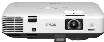
EPSON EB-1940W 4200lm

三つ目は、多機能パワーモデルのプロジェクターです。大きな会議室でも対応できる4200lmの明るさと持ち運びが容易な約3.7kgの重さが特徴で、場所を選ばず使用することができます。