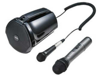
ワイヤレスマイク付き 拡声器スピーカー

ワイヤレスマイク付き拡声器スピーカーは会議やイベントなどで簡単に使用できます。本体は充電式になっているので、屋外での活動でも電源を確保せずに使用することができます。