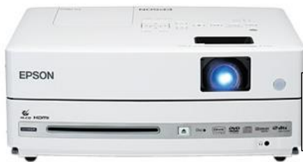
EPSON EH-DM30S 2500lm

一つ目は、以前より利用頻度の高いDVD一体型プロジェクターです。これ一台でDVDの再生とスピーカーからの音声出力、プロジェクターでの投影ができるので、大型スクリーンでのDVD視聴が手軽に実現可能です。